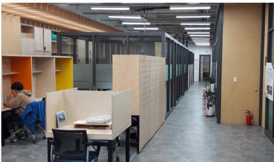
인큐베이팅 공간: 서울시 내 공동창업 공간

성장단계별 맞춤형 인큐베이팅 초기 시제품(MVP) 개발 교육, 협력기관 자원 연계