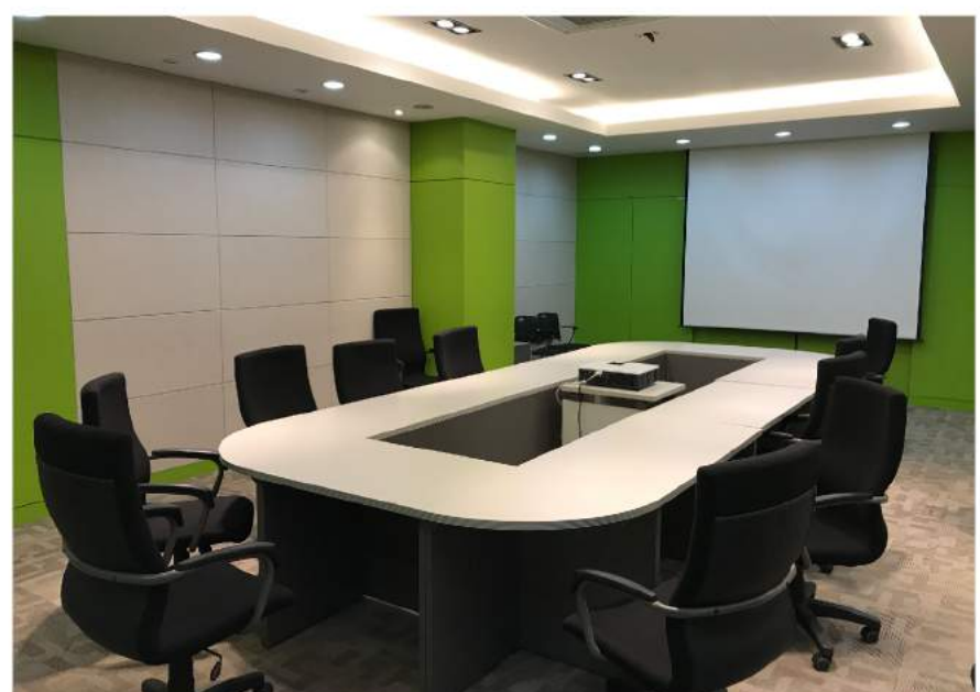
인큐베이팅 공간 : 경북 경산시 테크노파크 등 ■