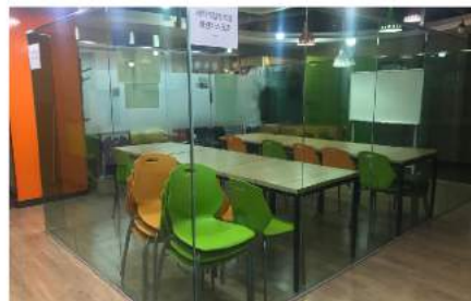
인큐베이팅 공간: 대전 서구 및 전국신협 ■